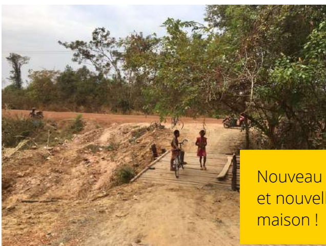
Nouveau pont et nouvelle maison !