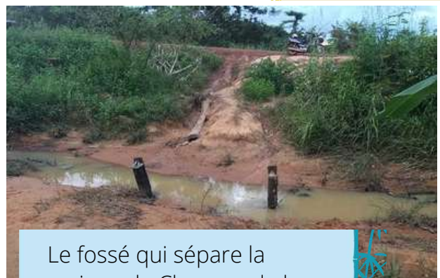
Le fossé qui sépare la maison de Charnon de la route.